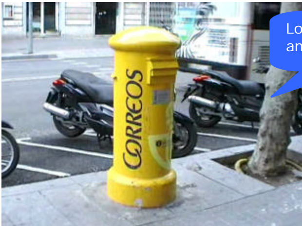
Los buzones son amarillos en España.