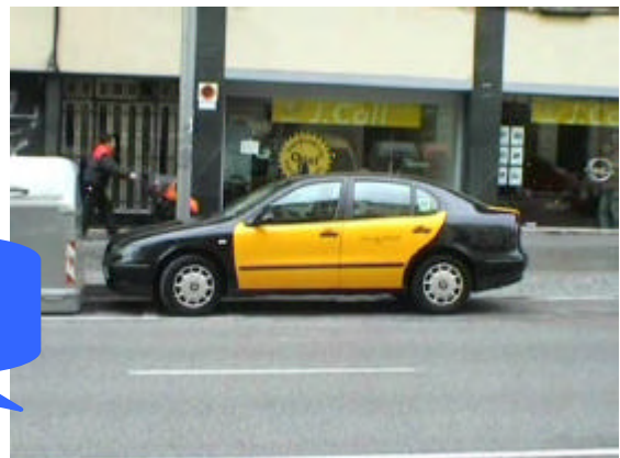
Los taxis son negros y amarillos en Barcelona.